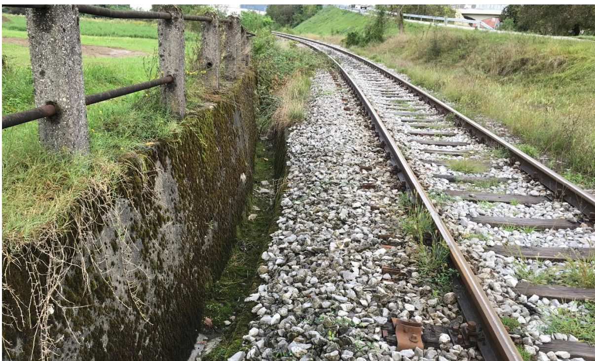
Slika 4: Pogled na oporni zid s kanaletom (levo) predvideno za rušenje