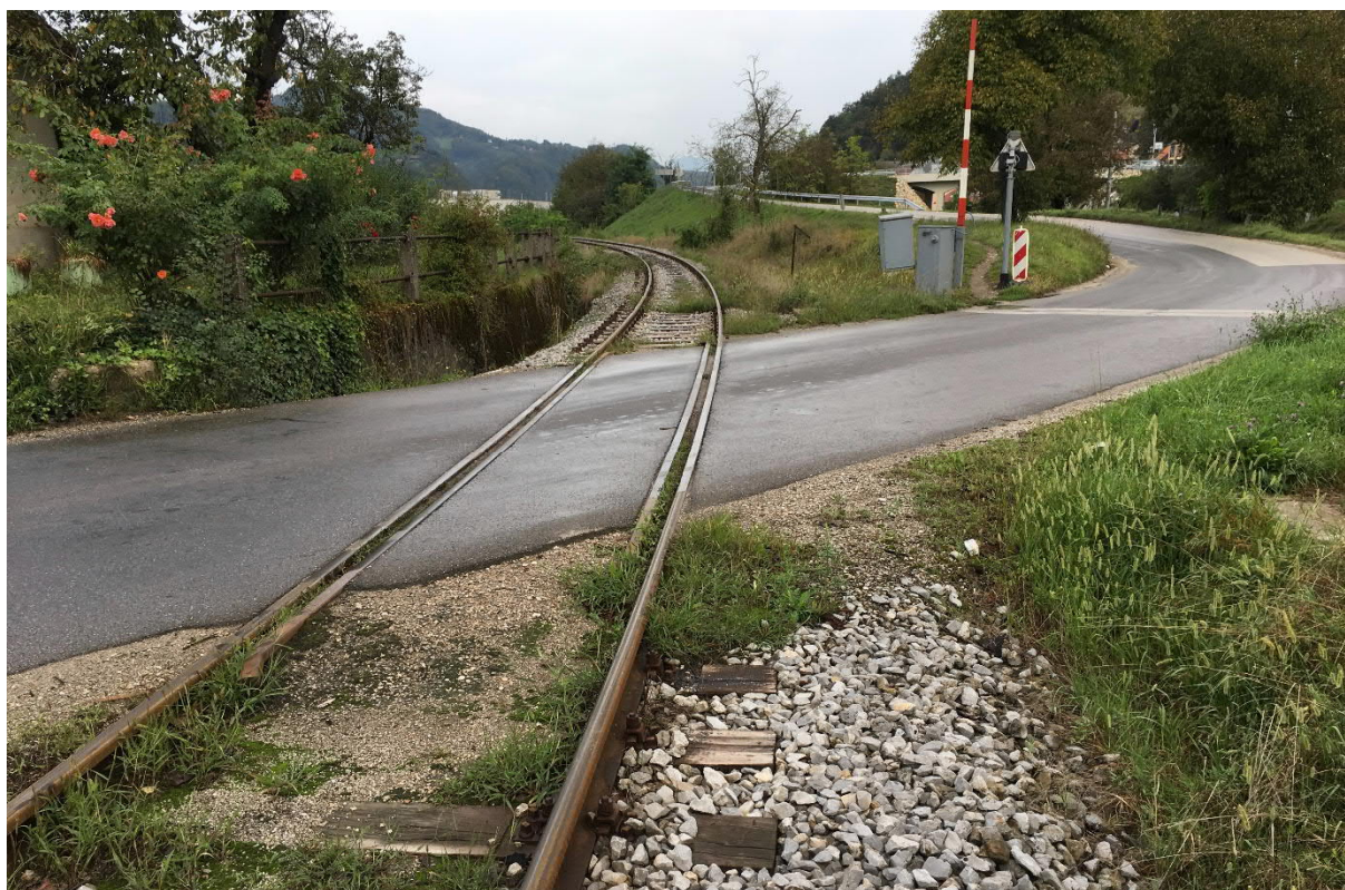
Slika 2: Pogled na NPR 0,7 Sevnica 1 v smeri stacionaže proge št. 81 oz. v smeri proti državni cesti R2-424/1166

Kot že povedano se nivojski prehod NPR 0,7 (Sevnica 1), ki se ukinja, nahaja v kilometru 0+663,95 proge št. 81. Gre za avtomatski nivojski prehod, zavarovan s polzapornicami.