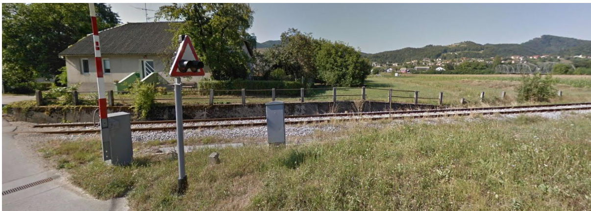
Slika 3: Pogled na oporni zid z ograjo (levo) in objekt v ozadju, oboje predvideno za rušenje

Hermanova cesta 4 projektno predviden za rušitev (sliki v nadaljevanju). Na desni strani pa se nahaja za nivojskim preходом v smeri stacionaže le kanaleta v dolžini 20,0 m, ki je tudi predvidena za rušenje zaradi zamenjave zgornjega in spodnjega ustroja tirnih naprav na širšem območju nivojskega prehoda.