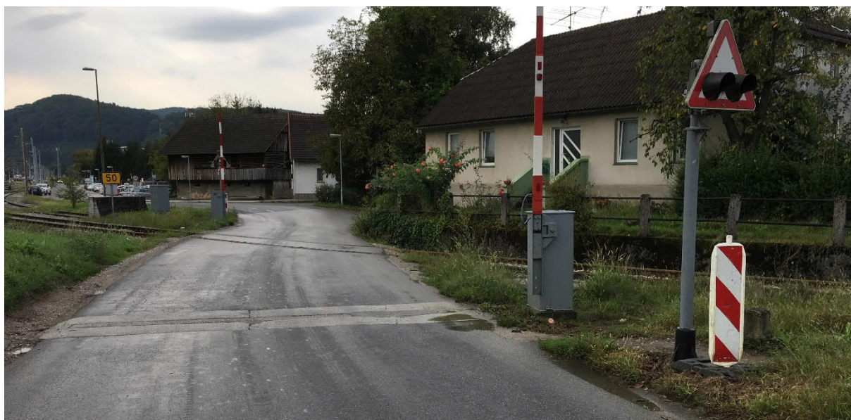
Slika 5: Pogled na NPr 0,7 Sevnica 1 iz cestišča v smeri industrijske cone Sevnica

V km 0+663,95 regionalne proge št. 81 Sevnica–Trebnje progo nivojsko križa lokalna cesta LC 373071 (NPr 0,7 Sevnica 1). Železniški prehod je zavarovan s svetlobno-zvočno signalizacijo in polzapornicami (sistem DK). Kot križanja med cesto in železnico je razmeroma neugoden saj znaša okoli 45°. Tirnice na nivojskem prehodu so sistema 49E1 na lesenih pragih. Železniška proga na območju nivojskega prehoda je v blagem vzponu (3,679 ‰) in se situativno nahaja v levem krožnem loku R250 m z nadvišanjem 45 mm. Glede na horizontalne in vertikalne elemente železniške proge je največja hitrost na tem odseku 60 km/h (oz. je v smeri proti postaji Sevnica, tika za nivojskim prehodom največja hitrost omejena na 50 km/h).